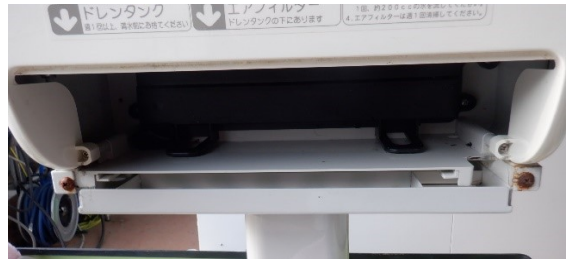
下部取付ネジの錆が有る。